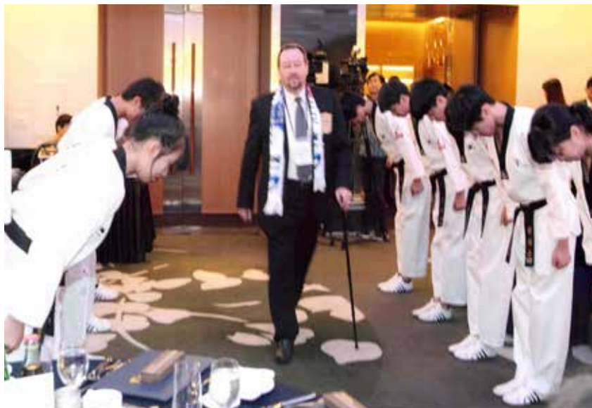
환 2016 국기원 자문위원회 임명 및 초청행사 영 The APPOINTMENT CEREMONY For The KUKKIWON ADVISORY COMMITTEE 2016.8.6 - 2016.8.7